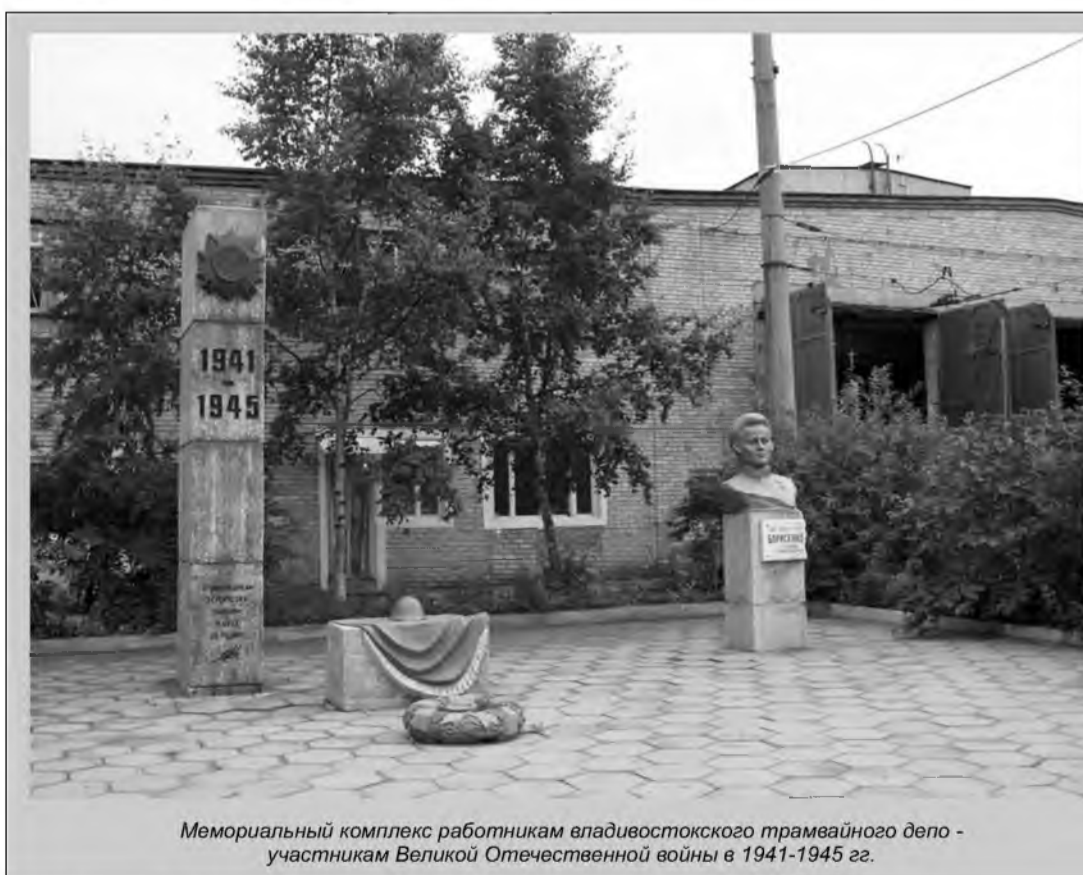
Мемориальный комплекс работникам владивостокского трамвайного депо - участникам Великой Отечественной войны в 1941-1945 гг.